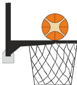
Figure 3 : Ballon en contact avec l'anneau

C'est une intervention illégale pour un joueur défenseur ou attaquant si, lors d'un tir au panier, ce joueur touche le panier (l'anneau ou le filet) ou le panneau alors que le ballon est en contact avec l'anneau et qu'il a encore une chance de pénétrer dans le panier.