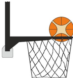
Figure 4 : Ballon à l'intérieur du panier

Il y a violation pour intervention illégale si un joueur défenseur touche le ballon quand il est à l'intérieur du panier.