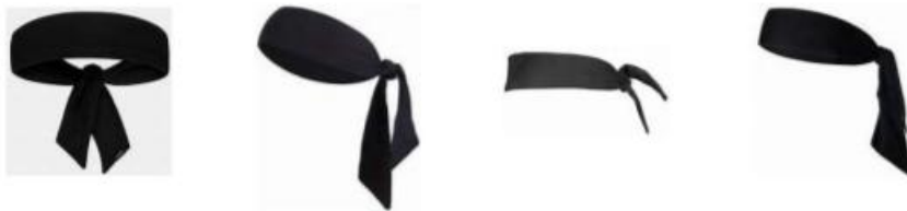
Figure 1 : Bandeau de tête de type bandana

Le port de bandeau de tête de type bandana (bandeau noué) n'est pas autorisé