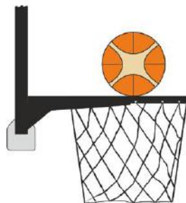
Figure 3 : Ballon en contact avec l'anneau

C'est une intervention illégale pour un joueur défenseur ou attaquant si, lors d'un tir au panier, ce joueur touche le panier (l'anneau ou le filet) ou le panneau alors que le ballon est en contact avec l'anneau et qu'il a encore une chance de pénétrer dans le panier.